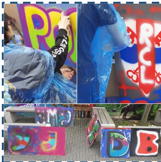
Creatieve activiteit tijdens de levelweek: graffiti spuiten

De levelweken zijn weken waarin leerlingen o.a. kunnen "levelen". Dat betekent dat ze toetsen kunnen inhalen die ze gemist hebben en voor een tweetal vakken een herkansing kunnen doen. De afspraken hierover maken ze met de vakdocent of met hun coach. In de middagen volgen ze een alternatief programma, gericht op sociaal-emotionele vaardigheden, sport, burgerschap of creatieve vorming. Bij de afgelopen levelweek hadden we de leerlingen van alle groepen gemixt en dat werd door iedereen als heel positief ervaren. Vanwege de verschillende roosters was het echter erg moeilijk om een goed programma samen te stellen. Daarom hebben we besloten om tijdens de volgende levelweken de eindtijden van alle groepen (m.u.v. de examenklas) gelijk te trekken. Dat betekent dat de leerlingen in die weken van maandag tot en met donderdag om 14.30 uur uit zijn en op vrijdag om 12.10 uur. De MR heeft dit voorstel goedgekeurd..